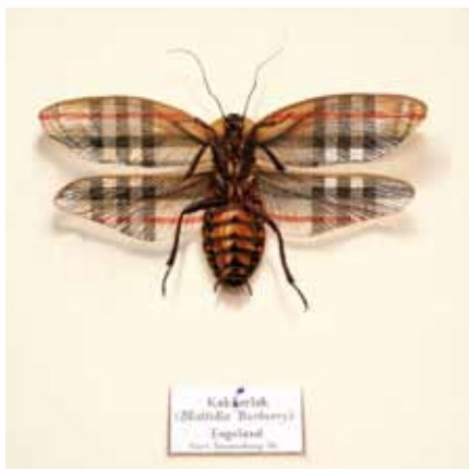
Gurt Swanenberg, Kakkerlak, olieverf op paneel, 21 x 21 cm, 2006

rend de antwoorden. Als we zijn werk bestuderen, zien we in zijn natuurvormen pas in tweede instantie de bekende namen: McDonalds, Microsoft, Burger King of Yves Saint Laurent. Knap geschilderd, subtiel maar onmiskenbaar: een kakkerlak met Burberry-vleugels, een heremietkreeft met de schelp van Shell. Consumers paradise. De variaties zijn eindeloos. Op absurdistische wijze toont Swanenbergs beeldtaal een scenario voor de moderne evolutie.