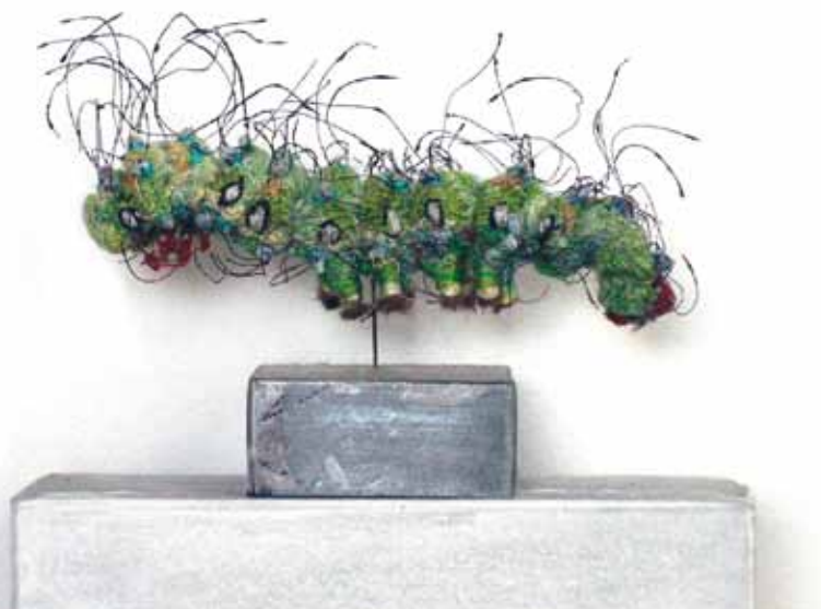
Saskia E.M. van Dijk, Rups van de grote nachtpauwoog, garen, dun koperdraad op gesoldeerde zinken sokkel van 3-1,2 cm, totale hoogte 5,5 cm. 2009

Swanenberg: “De schoonheid van de natuur is al eeuwen een inspiratiebron voor kunstenaars. In de 17e eeuw was onder rijke handelslieden de gewoonte ontstaan om verzamelingen aan te leggen van vlinders, insecten en andere objecten. Het was de wereld in het klein, een afspiegeling van een nauwelijks verkende aardbol. De uitgestalde objecten gaven prestige en aanzien. Bij die verzamelwoede speelden, behalve nieuwsgierigheid, ook andere aspecten een rol. Religieuze beweegredenen bijvoorbeeld. Door bewijsmateriaal van Gods schepping in huis te halen, kon men nader tot de Schepper komen.” De schilderijen van Gurt Swanenberg tonen een modern rariteitenkabinet, waarin de liefde voor het verzamelen van preparaten, de invloed van de huidige consumptie-maatschappij, religie en traditionele fijnschilderkunst zijn samengesmolten.