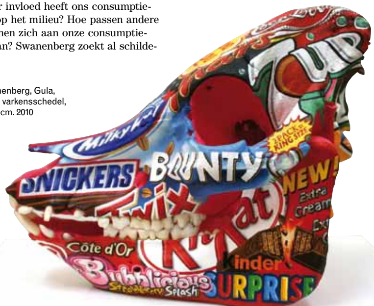
Gurt Swanenberg, Gula, olieverf op varkensschedel, 18 x 11 x 15 cm. 2010