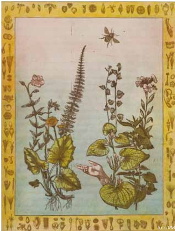
Ik heb u het zaadzaaiende kruid gegeven 50 x 65 cm • ets (25) • 2008 • 425,- euro (excl. lijst)